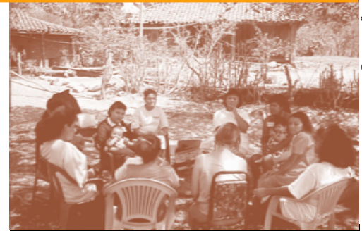
Un grupo focal con madres en el Municipio de Berlín, Usulután, El Salvador.

IEQ elaboró un informe sobre la asistencia técnica provista bajo el proyecto IEQ, titulado “Informe de El Salvador sobre la Asistencia Técnica para el Estudio de Prácticas de Crianza en dos Áreas de Usulután.” Este informe presenta las lecciones aprendidas en relación al desarrollo de la capacidad de las ONGs, de llevar a cabo investigaciones con diseño multi métodos en educación inicial. Los instrumentos desarrollados bajo esta actividad incluyen guías de observación, una encuesta para padres de familia y guías de entrevista y grupos focales.