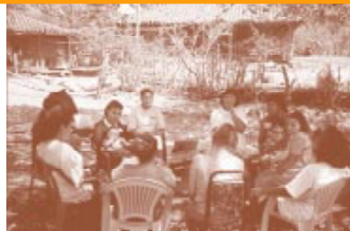
Groupe de discussion focalisée avec des mères dans la municipalité de Berlin,

IEQ a préparé un rapport sur l'assistance technique fournie dans le cadre d'IEQ, intitulé Rapport du Salvador sur une Assistance technique à une Etude sur les Pratiques de Développement de l'Enfant dans deux régions d'Usulután . Le rapport présente les leçons apprises sur le renforcement des capacités des ONG afin qu'elles puissent réaliser des recherches avec plusieurs méthodes sur l'éducation du jeune enfant. Les instruments mis au point dans le cadre de cette activité sont des formulaires d'observation, une enquête auprès des parents ainsi que des guides d'interviews et de discussion focalisée.